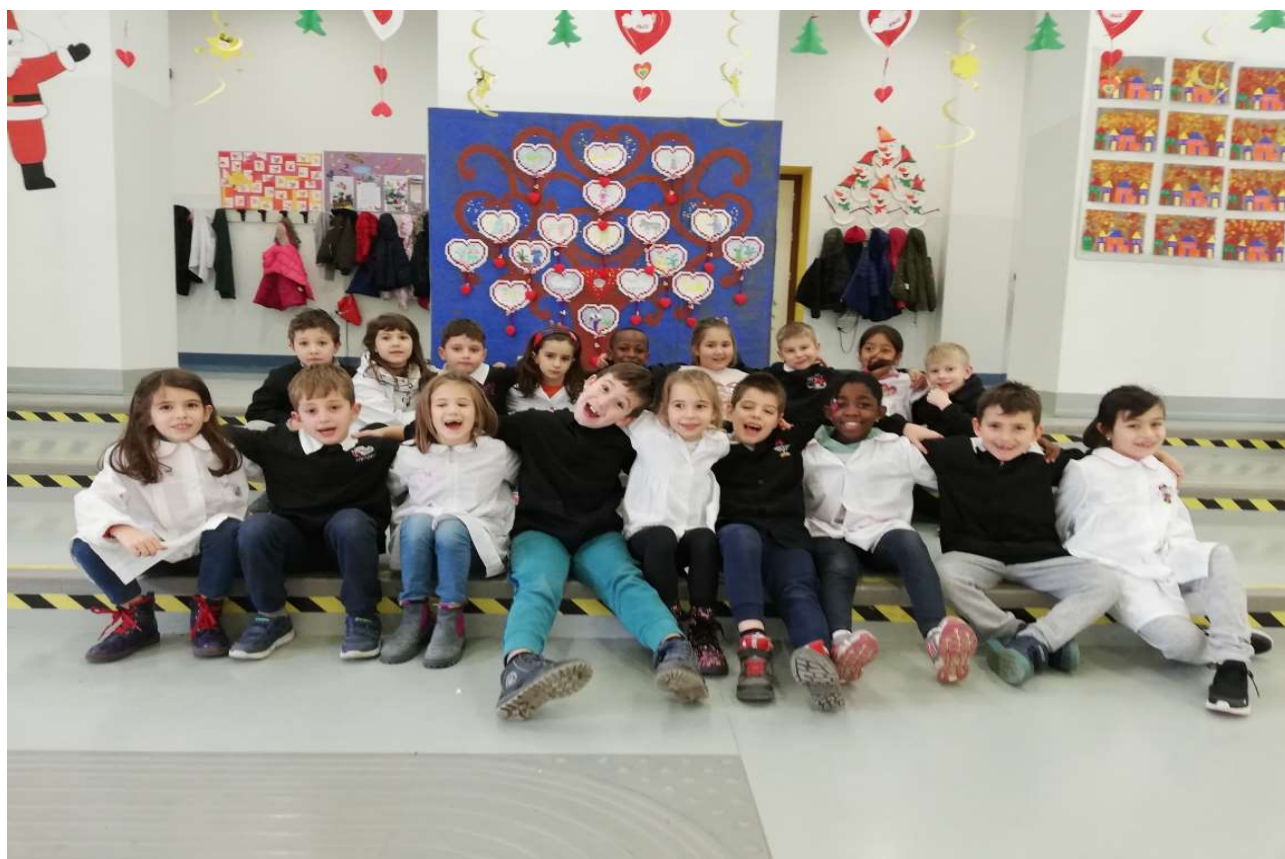
Classe 2 ^ B, scuola primaria "I.Nievo"

Con parte della vincita abbiamo fatto una donazione ad una Associazione che si occupa di sostenere alcuni bambini del Congo , che abbiamo potuto conoscere attraverso delle foto che le operatrici ci hanno mostrato quando sono venute a trovarci a scuola. E' stato un momento molto emozionante che abbiamo condiviso con i nostri amici di 2 ^ A e C riflettendo insieme sul fatto che non tutti i bambini hanno gli stessi diritti e noi abbiamo il dovere di non dimenticarlo, impegnandoci ogni giorno a diventare dei bravi CITTADINI DEL MONDO!